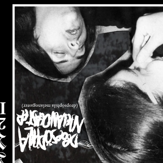
Dropsophila Melanogaster 2004 Independiente