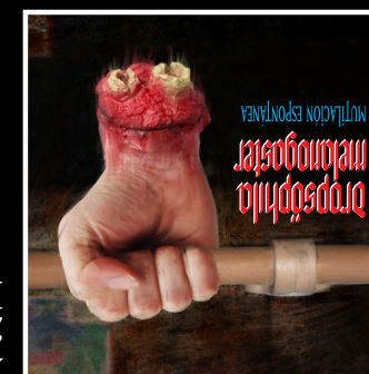
Mutillacion espontanea 2006 Independiente