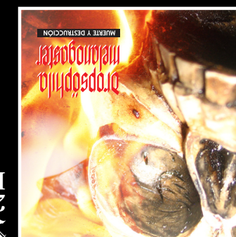
Muerte y destruccion 2005 Independiente